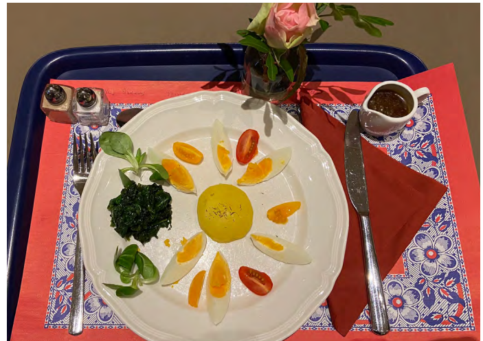
De kookvrijwilligers zorgen er voor dat elke maaltijd er feestelijk uitziet

Veel dank gaat uit naar de grote groep vrijwilligers die zich belangeloos inzet voor ons hospice.